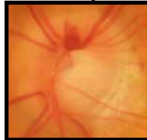
Riäak de rël thii ë nyin

Tuaany ë nyin ye rël ë roŋ rac athiäkic kekë atuöc ë nyinic, tedö yen akuötic tēnë koc ke noŋ atuöc tö abec ku noot ëke noŋ tuaany ë nyin ye rël ë roŋ rac. cït men de them atuöc, athëm de tuaany ë nyin ye rël ë roŋ rac aya anoŋic tiëŋ de rël thii ë nyin, luoci them ë daai ku thuur tö nhom tuen.