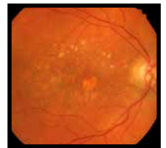
Acuol tõ ë nyinic Në miith ë nyic cï goolic

LO PINY Ë MIITH Ë NYIN CÏ GOOLIC THIAÄK KEK RUN